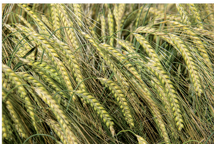
24 de mayo