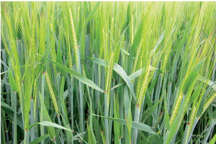
Fecha de siembra: 18/11/2019