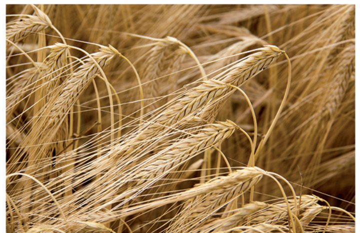
8 de junio