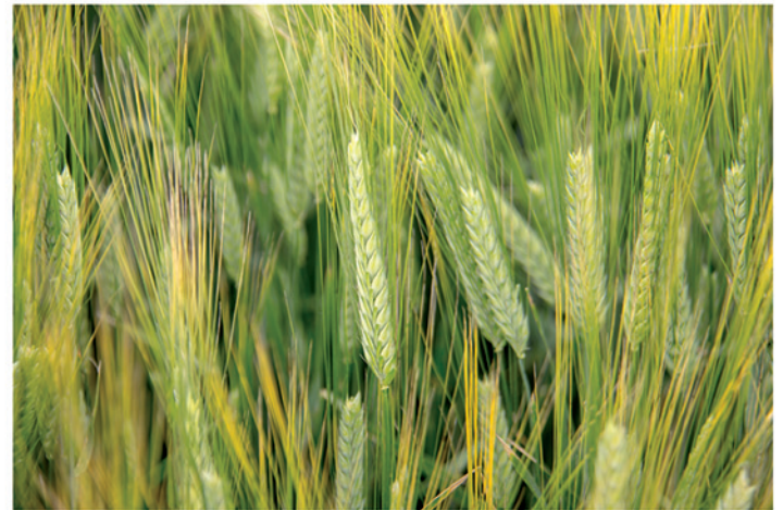
12 de mayo