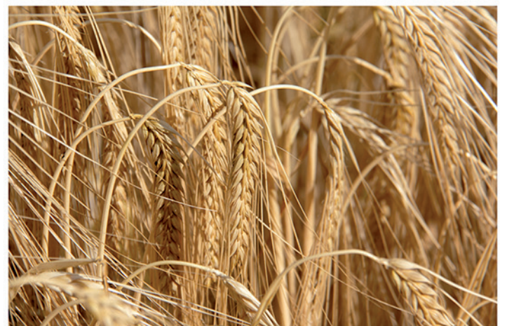
8 de junio