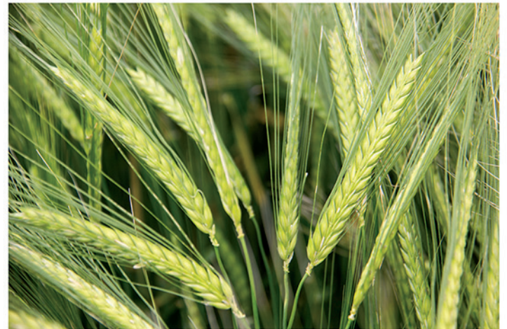
12 de mayo