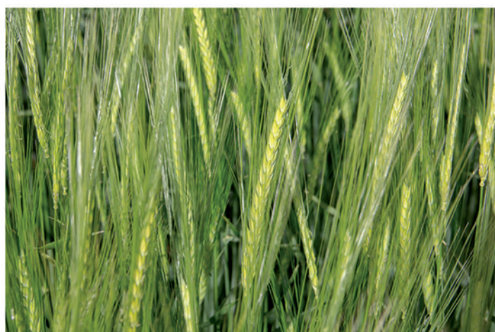
Fecha de siembra: 18/11/2019