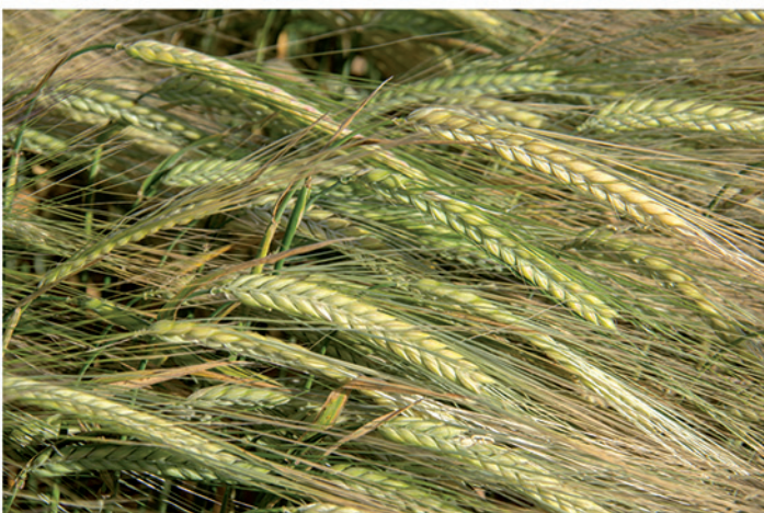
24 de mayo