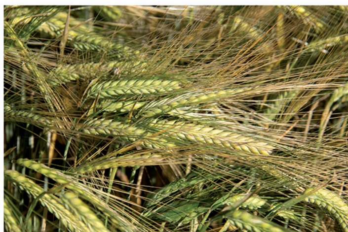
24 de mayo