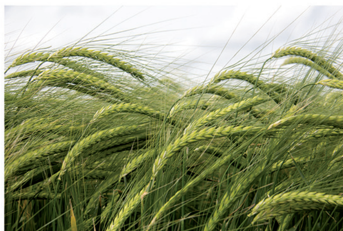
12 de mayo