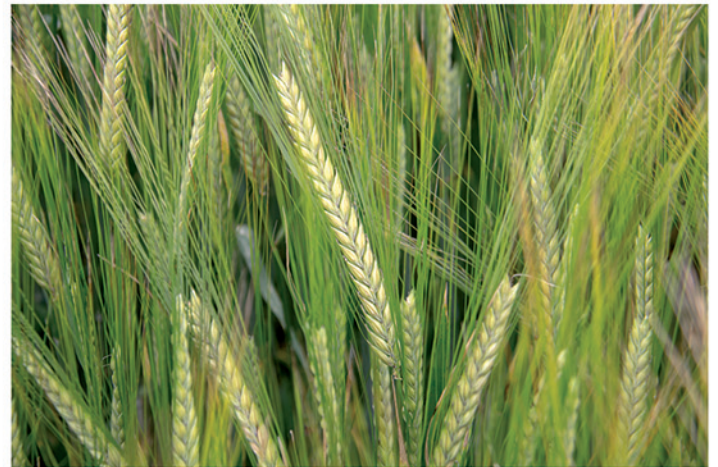
12 de mayo