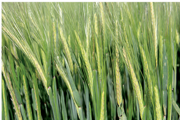
Fecha de siembra: 18/11/2019