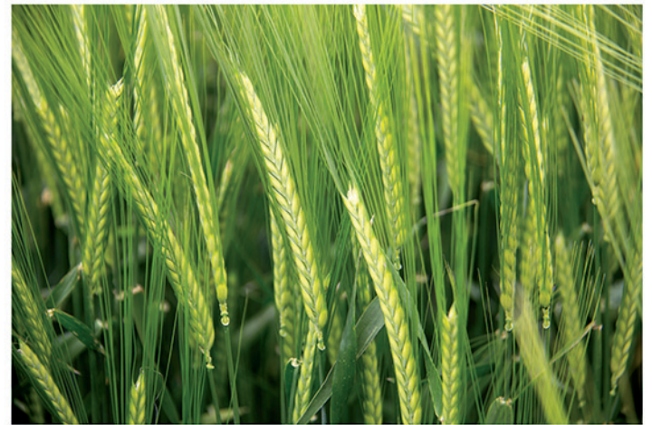
12 de mayo