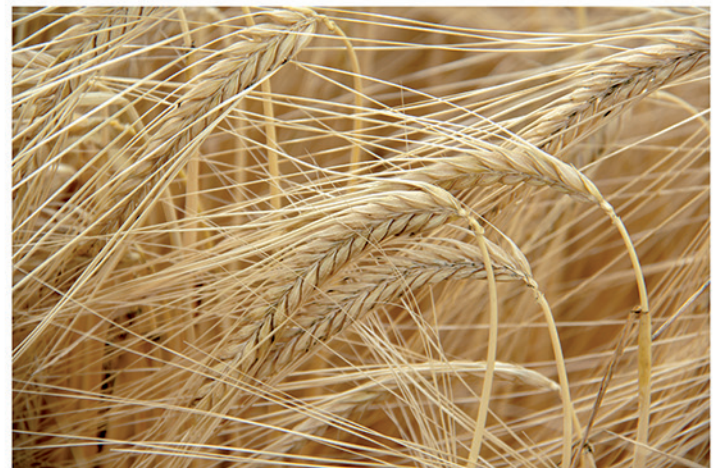
8 de junio