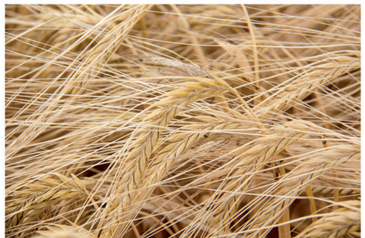
8 de junio