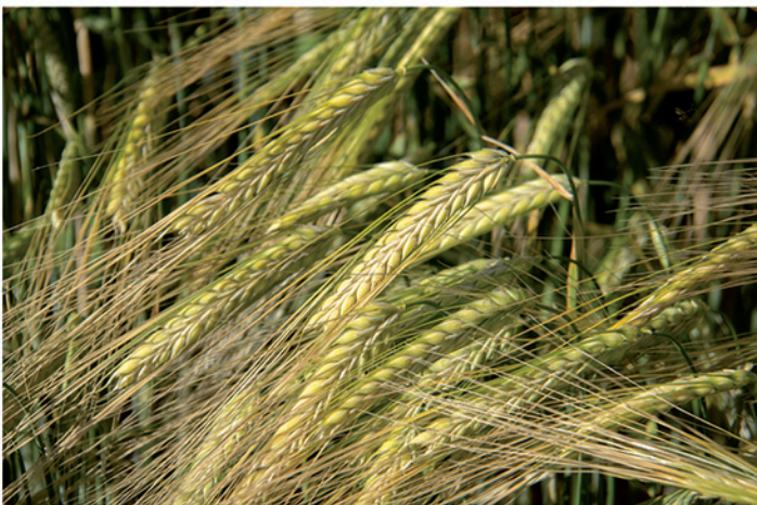
24 de mayo