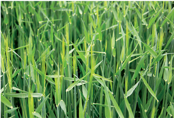
Fecha de siembra: 18/11/2019