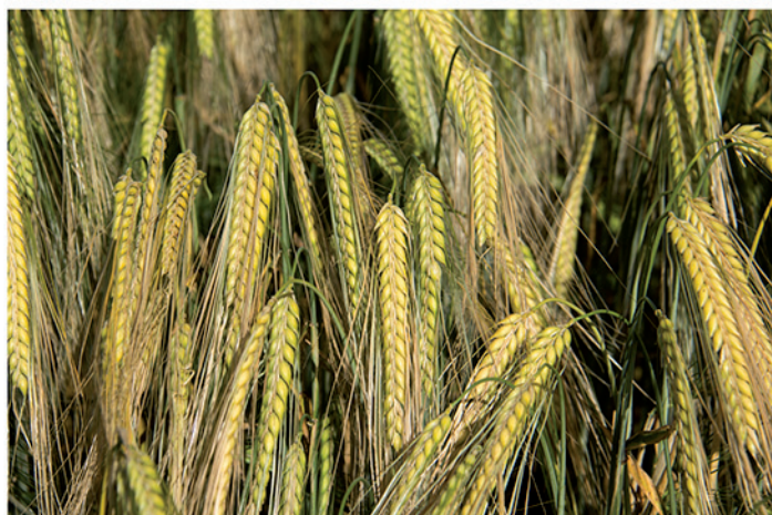
24 de mayo