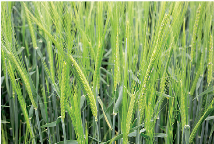
Fecha de siembra: 18/11/2019