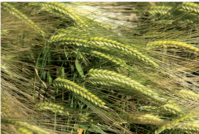
24 de mayo