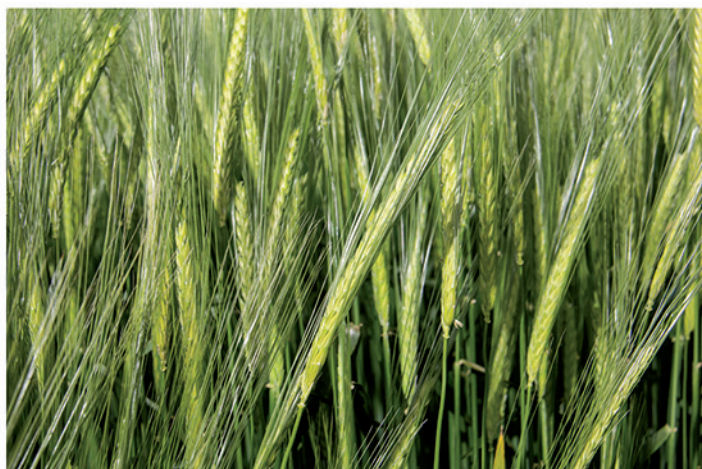
Fecha de siembra: 18/11/2019