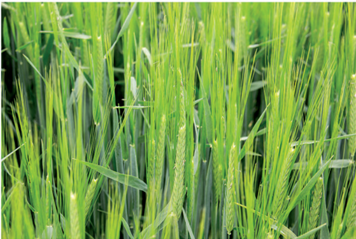
Fecha de siembra: 18/11/2019